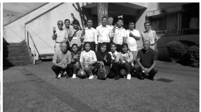
2019年10月5日技能実習生 小山市 きぼう国際外語学院 配属前 風景