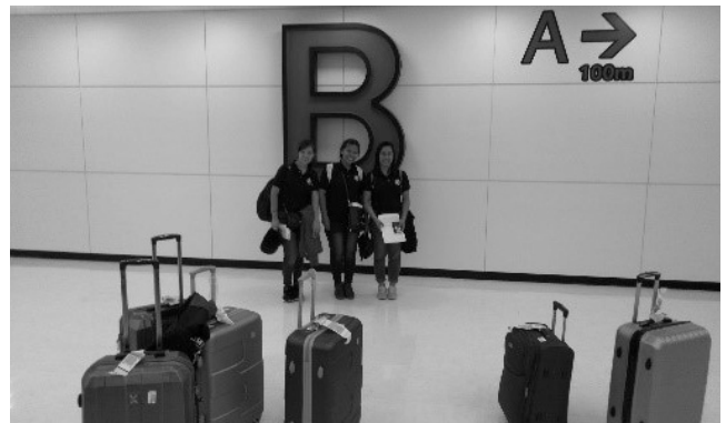
2019年5月9日 フィリピン人入国