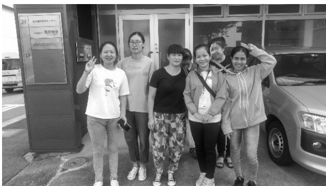
2019年9月21日技能実習生 名古屋高日研修センター 配属前 風景